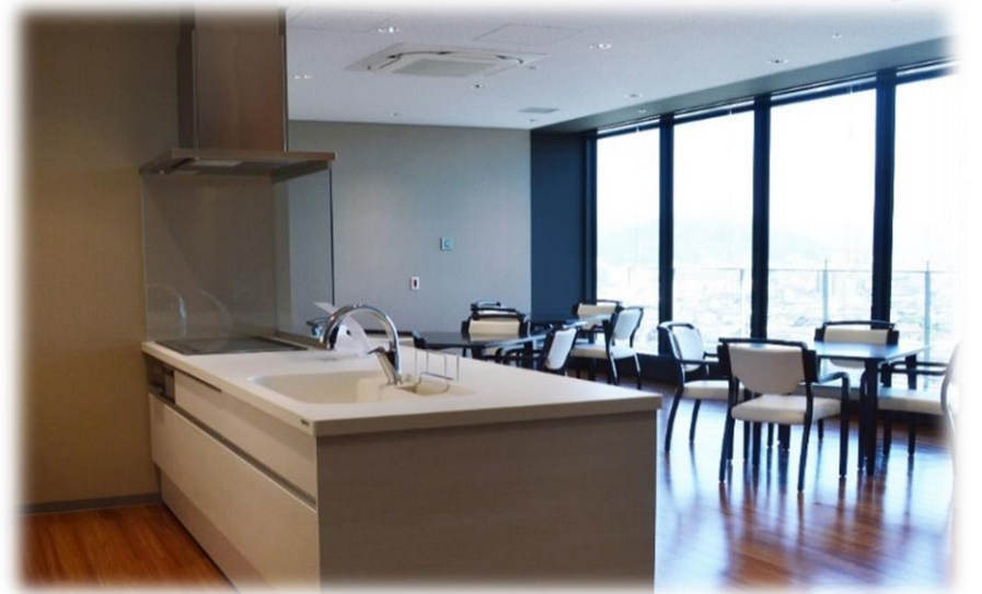
リラクゼーション ルーム